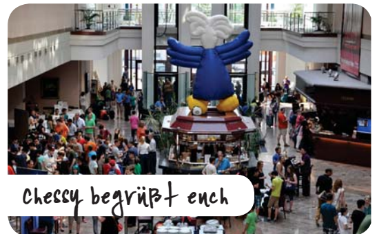
chessy begrüßt euch