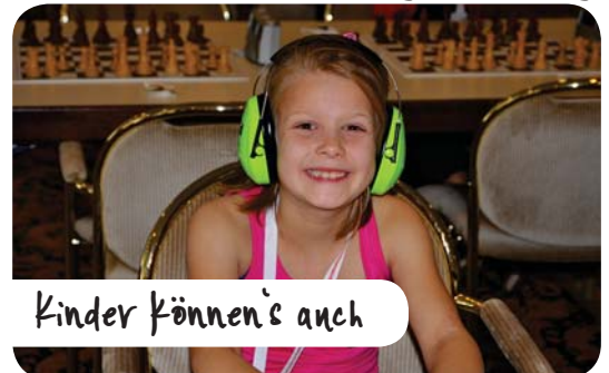
Kinder können's auch