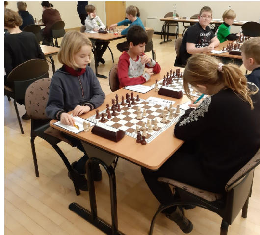
Die Neustrelitzer Schachspieler von der TSG sind bei vielen Turnieren aktiv.